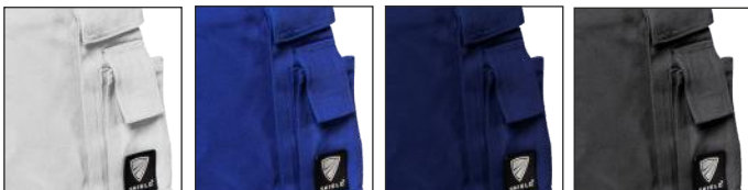
01-Weiss 11-Königsblau 13-Marineblau 32-Grau

Die Farbe Marineblau ist komplett ohne Knieverstärkung