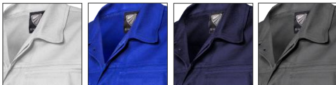
01-Weiss 11-Königsblau 13-Marineblau 32-Grau